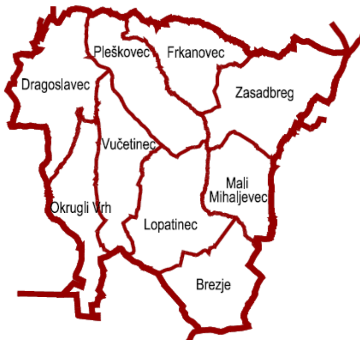
Prikaz 2 Naselja Općine